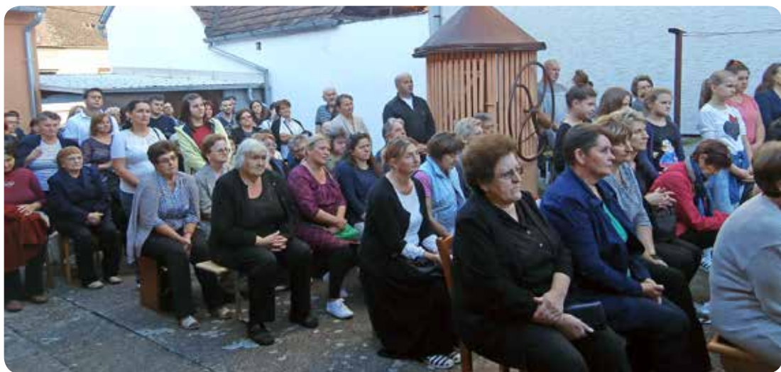
Vjernici u dvorištu samostana u Slatini