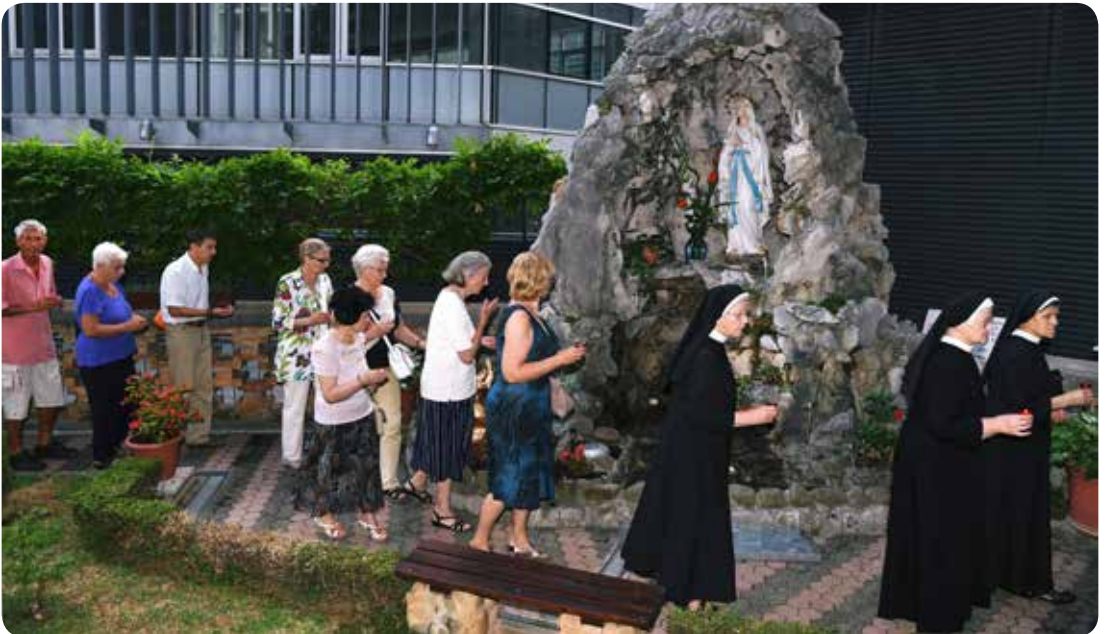
Vjernici i sestre u procesiji