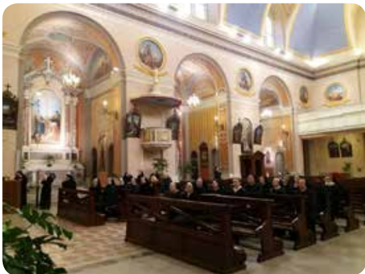
Sestre u kapucinskoj crkvi na Montuzzi

U godini Jubileja milosrđa nastojali smo upoznavati Božju ljubav i milosrđe i dijeliti ih onima koje smo susretali. Svjesni smo kako nas Bog predusreće, pomaže i nalazi svojim milosrđem u kojem i mi nalazimo snagu za djela milosrđa. U Buli najave Izvanrednog jubileja milosrđa papa Franjo je rekao: “Pogleda upravljena prema Isusu i njegovu milosrdnom licu, možemo iskusiti ljubav Presvetoga Trojstva. Isus je primio od Oca poslanje da objavi otajstvo Božje ljubavi u njegovoj punini: ‘Bog je ljubav’ (1 Iv 4, 8.16), kaže evanđelist Ivan prvi i jedini put u cijelome Svetom pismu” ( Misericordiae vultus , br. 8). To nam je bio poziv da se još jednom prisjetimo bezuvjetne Božje ljubavi kojom nas ljubi unatoč našim nevjernostima. Bog je svoj narod u Staromu zavjetu često poticao na sjećanje svega što je za njih učinio u svojoj ljubavi kada ih je izveo iz egipatskoga ropstva. Isus je također svoje učenike poticao da pogledom zahvalnosti gledaju u prošlost svoga naroda. Sjećanje na Božje djelovanje u našim životima i zahvalnost za njih je nešto što bi trebalo resiti svaku od nas. Marija nam