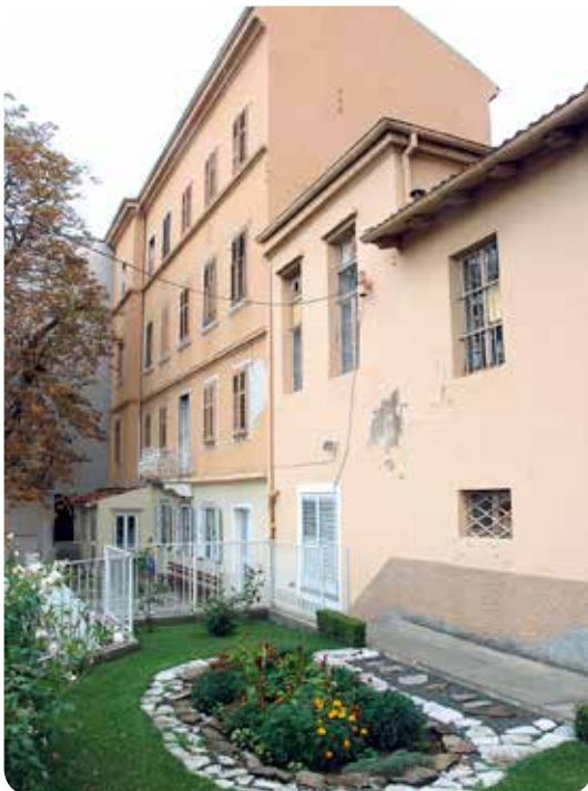
Kuća utemeljenja Družbe

Uskoro je jedan drugi Marijin duhovnik, fra Kajetano iz Arzignana, OFM (1848. - 1917.), koji je u to vrijeme bio propovjednik u Zadru, posjetio Mariju i čestitao joj radujući se što je prigrllila redovnički život. Ostao je zadivljen njezinim radom i Zavodom i na povratku joj je napisao da se ona s pravom