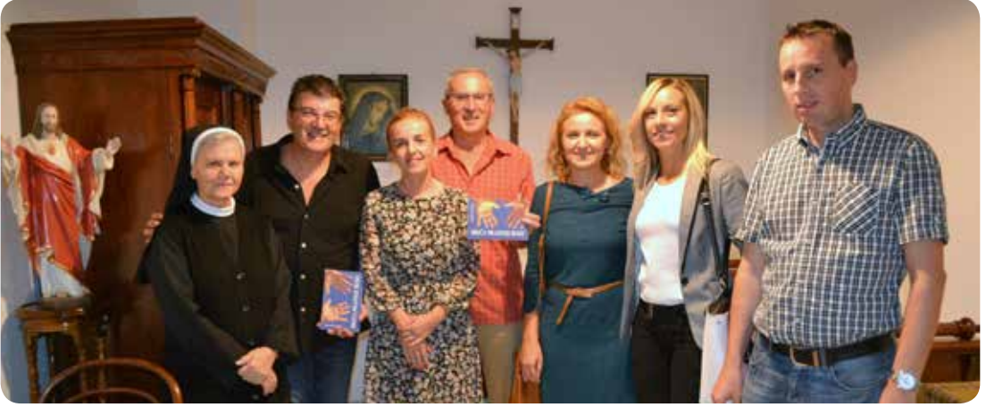
Članovi AKD-a "Jeronim" sa s. Dobroslavom u spomen-sobi

vatima, na slavu Božju. Službenica Božja imala je u svojoj kući svjedočanstvo oca koji se uzda u Boga, i što je mogla kći nego poput svoga oca, onom ljubavlju koju je i sama doživjela, biti majka tolikoj napuštеноj djeci i svima potrebitima, biti svima sve. Pozvani smo u Mariji Krucifiksi prepoznati produženu Božju ruku i nasljedovati je, zaključio je dr. Velčić.