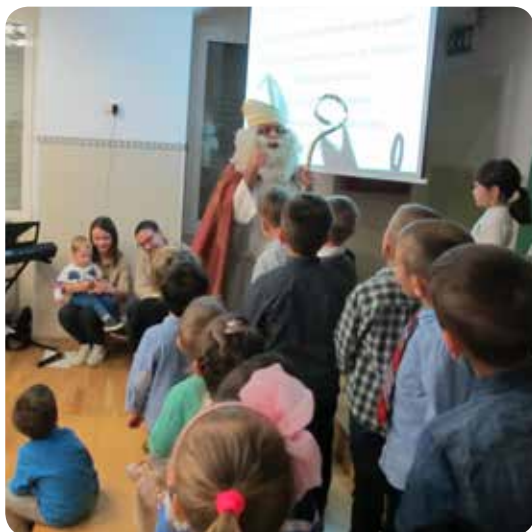
sv. Nikola u dječjem vrtiću “Mima”

Dječji vrtić “Nazaret” Družbe sestara Presvetog Srca Isusova u Rijeci povodom Godine prenošenja vjere u Riječkoj nadbiskupiji pokrenuo je poseban godišnji projekt pod geslom: “Prenositelji vjere – obitelj, Crkva, vrtić”, jer su to po sebi tri nenadoknativa zasebna odgojna mjesta. U projekt su uključeni svi članovi obitelji, jer roditelji su prvi i glavni odgojitelji i trebaju biti prenositelji i svjedoci vjere svojoj djeci. Svakako, u odgoju osobito mjesto ima obitelj “koja je škola potpunije čovječnosti” ( Gaudium et spes , br. 52), ali za cjeloviti odgoj potrebna je zajednička angažiranost i suradnja roditelja, crkvene zajednice i odgojitelja osobito u ranoj životnoj dobi čovjeka.