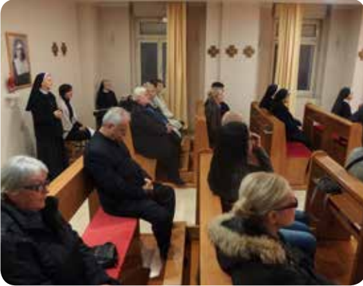
Štovatelji Riječke Majke u kapeli

Naprotiv, ona osniva red koji se posvećuje brizi za one odbačene, najsiromašnije, za one koji su nevidljivi oku i vidu tadašnjega društva. I zbog toga trpi – trpi brige i tjeskobe, sve do svoga izgnanstva iz Rijeke radi tadašnjih političkih okolnosti.