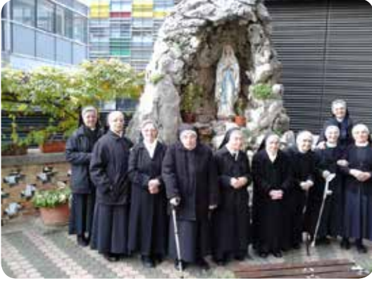
Sestre ispred zavjetne špilje Gospe Lurdske