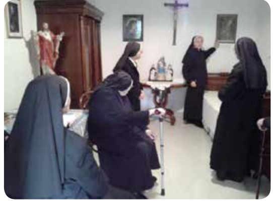
U spomen-sobi Majke Utemeljiteljice