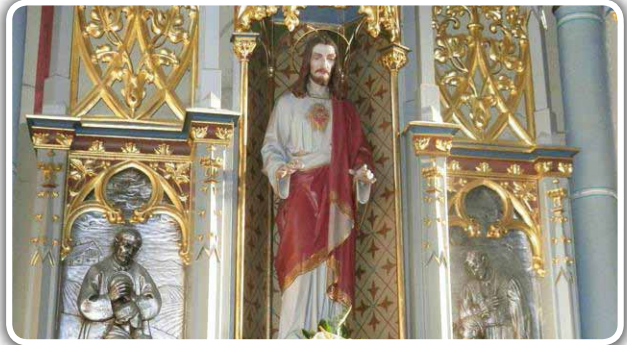
Pokrajnji oltar Presvetog Srca Isusova u slatinskoj župnoj crkvi sv. Josipa

Hrgić. U lijevoj lađi župne crkve sv. Josipa nalazi se oltar Presvetog Srca Isusova, koji je tu od gradnje crkve 1913. godine. Vidljivo je kako je Slatina, iako za zaštitnika ima sv. Josipa i po tome je prepoznatljiva, ipak sve vrijeme vezana i živi u znaku Presvetog Srca Isusova. U prilog toj činjenici idu događaji prije i nakon Prvog svjetskog rata. – Velik broj obitelji stavlja svoj život pod zaštitu Božanskog Srca, a istoimeni blagdan postaje zavjetni dan grada Slatine. U Slatinu kasnije dolazi au-